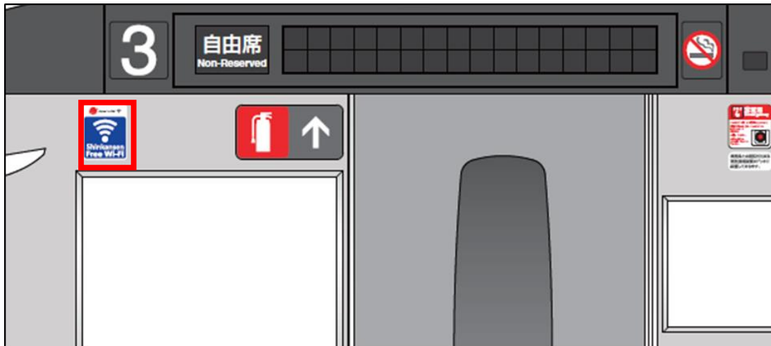
N700系における「Shinkansen Free Wi-Fi」ステッカーの掲出イメージ