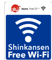
「Shinkansen Free Wi-Fi」 ステッカー