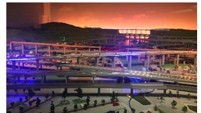
▲スペシャルジオラマ

開催期間 12月7日(木)～1月30日(火) (イベント期間中毎日) 時 間 ①11:00 ②12:30 ③13:30 ④14:30 ⑤16:00(各回約15分) 内 容 特別な照明や映像で、冬ならではの特別演出を施します。ジオラマ内を光で装飾する初めての試みです。イルミネーションや映像に彩られた鉄道ジオラマをぜひご覧ください。