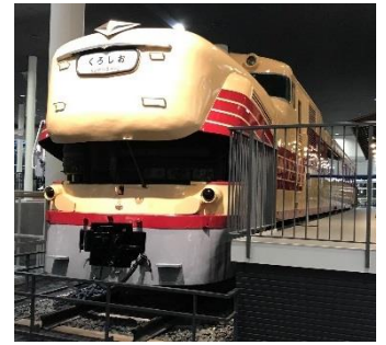
▲キハ81形ディーゼルカー

開催日 12月9日(土)・10日(日) 時間 ①10:00～12:00 ②12:45～14:45 ③15:00～17:00 (要整理券) ※すべての回の整理券を10:00から配布 場所 本館1階 キハ81形ディーゼルカー前特設会場 (整理券配布も同じ) 内容 2018年の「戌年」にちなみ、大きく“口”をあけたキハ81形ディーゼルカーの前でカメラマンが写真を撮影したデータをプレゼントします。 (写真撮影後、会場で撮影データのダウンロードページをご案内いたします。撮影データはご自身でダウンロードしてください。) ※キハ81形ディーゼルカーは、その見た目から「ブルドッグ」の愛称で親しまれています。