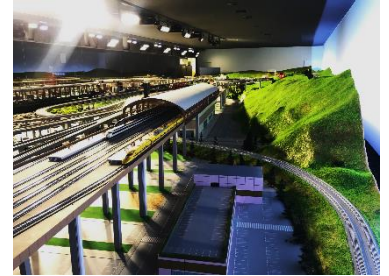
▲裏側から見た鉄道ジオラマ

開催日 1月4日(木)、6日(土)、11日(木)、13日(土)、 18日(木)、25日(木) 集合時間 各日16:20 (所要時間：約15分) 定 員 各日30名 参加方法 往復はがきでの事前申し込み (詳細ホームページ参照) 内 容 鉄道ジオラマの“ウラガワ”を初公開！普段は入ることができない場所をスタッフが解説付きでご案内します。