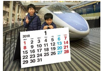
▲フォトスポット(イメージ)

開催期間 12月7日(木)～1月30日(火) (イベント期間中毎日) 場 所 本館1階500系前・100系前・車両工場、トワイライトプラザ 内 容 館内4箇所のフォトスポットにそれぞれ3か月分のカレンダーボードを設置します。すべての写真を撮ると、2018年1月から12月までのカレンダーが完成します。この冬だけのカレンダー製作をお楽しみください。 ※都合によりフォトスポットの設置場所を変更する場合があります。