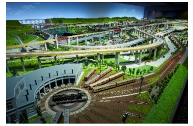
▲鉄道ジオラマ内の扇形車庫

開催期間 12月7日(木)～1月30日(火) (イベント期間中毎日)| 時 間 ①10:45 ②15:45 (各回約15分) 内 容 スペシャルジオラマの運転の前に、鉄道ジオラマに広がる建物や駅・橋りょうなどについてスタッフが見どころを紹介します。